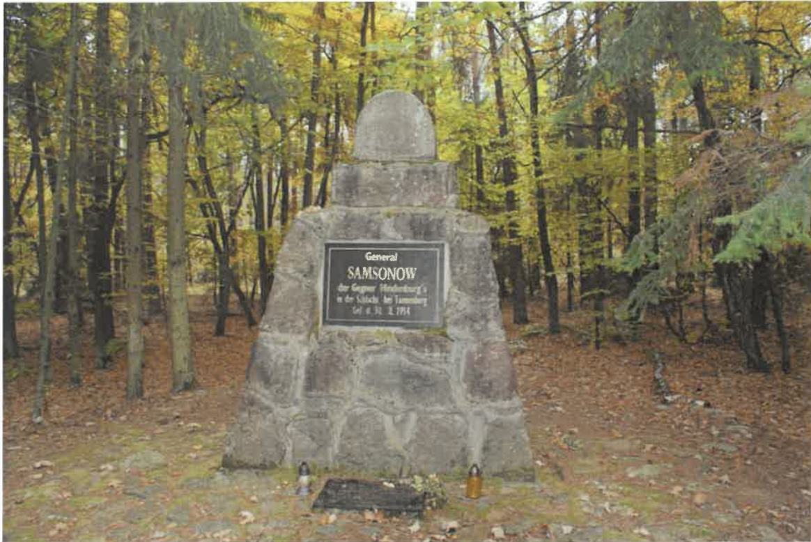
Fot. Obelisk upamiętniający miejsce śmierci gen. Samsonowa